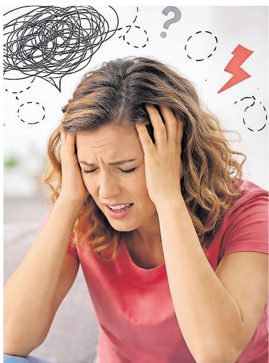
Besonders Frauen mit ADHS leiden viele Jahre still unter den Symptomen und führen es selbst auf eigenes Versagen zurück